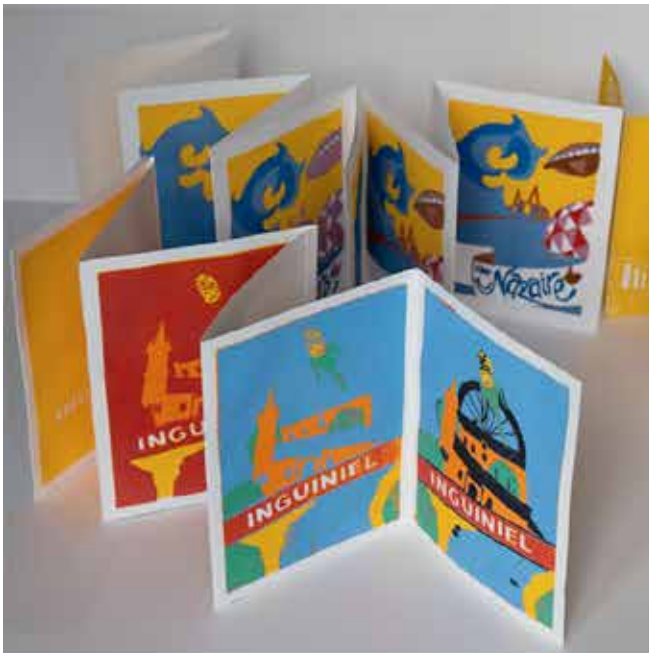
DN MADE /// GRAPHISME