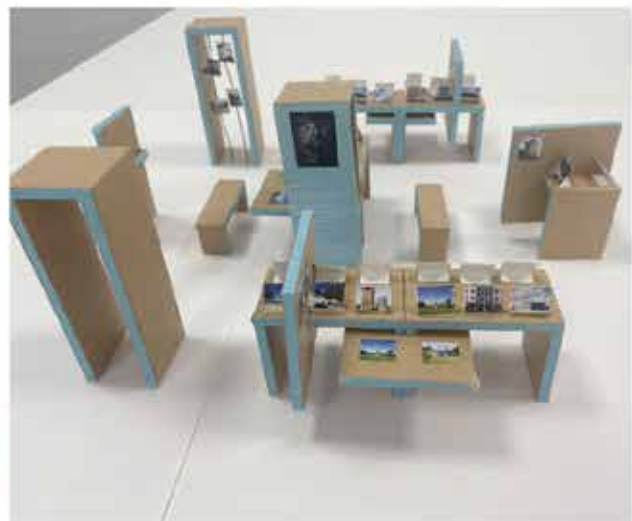
DN MADE /// NUMERIQUE