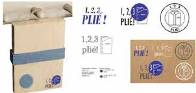
DN MADE /// EVENEMENTIEL